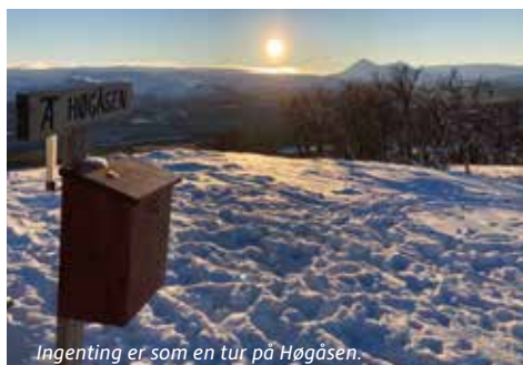
Ingenting er som en tur på Høgåsen.