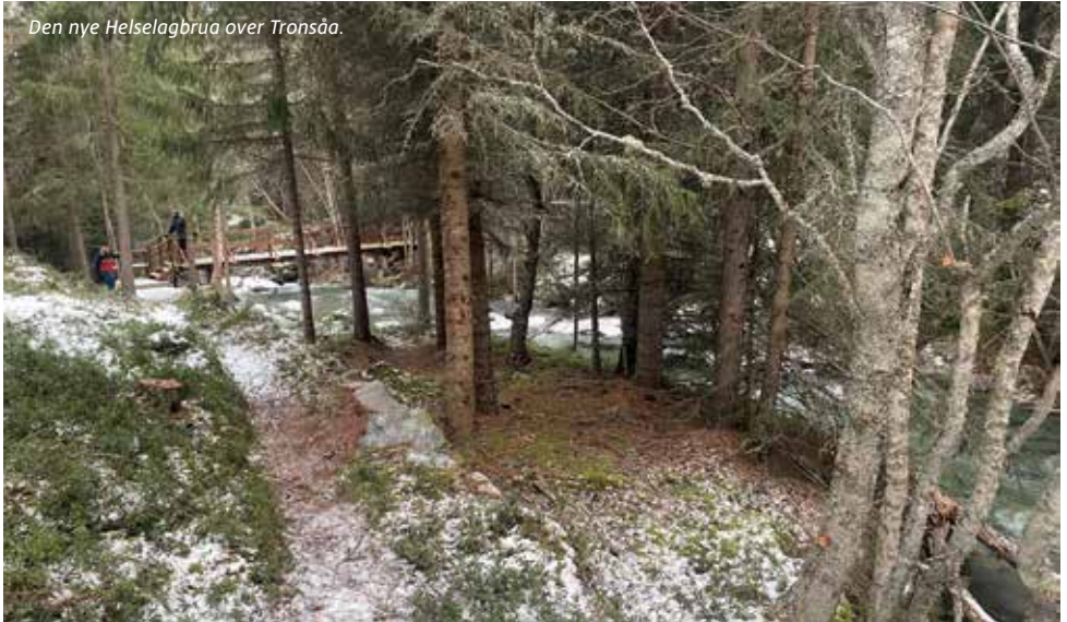
Den nye Helselagbrua over Tronsåa.

Liguria-kysten i Italia. Turen ble som kjent annonsert i juni 2024, interessen har vært veldig bra. 22 stk er påmeldt. Det er plass til 2 stk til ved interesse. Cinque Terre står høyt på Unesco's verdensarvliste og ikke uten grunn. Ryktene sier at noe mer idyllisk og fredelig skal man lete lenge etter. Programmet finner du på www.turforening.no .