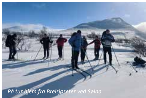
På tur hjem fra Breisjøseter ved Sølva.