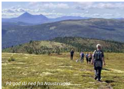
På god sti ned fra Naustervola