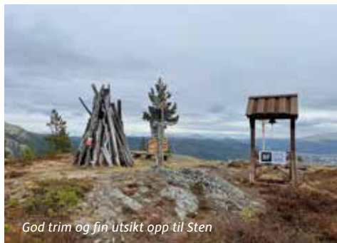
God trim og fin utsikt opp til Sten

Vår store turklasikker sammen med 2 dagers tur til Breisjøseter. En av de store fordelene med tiltaket er at en blir bedre kjent i bygda og i fjellregionen vår. Materiell kan kjøpes fra torsdag 15. mai på Alvdal Bok- og Papirhandel.