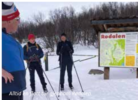
Alltid en flott tur gjennom Rødalen.

Medarrangør: Follidal og Hamar Turforening.