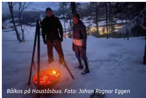
Bålkos på Hauståsbua.