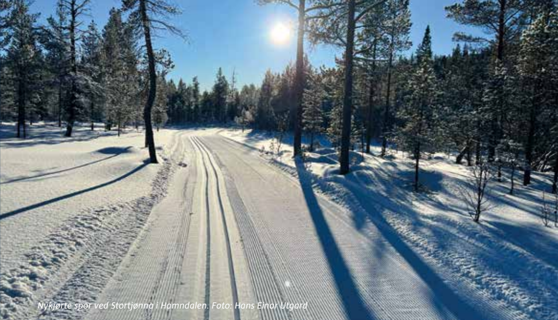
Nykjørt spor ved Stortjønna i Hamndalen.