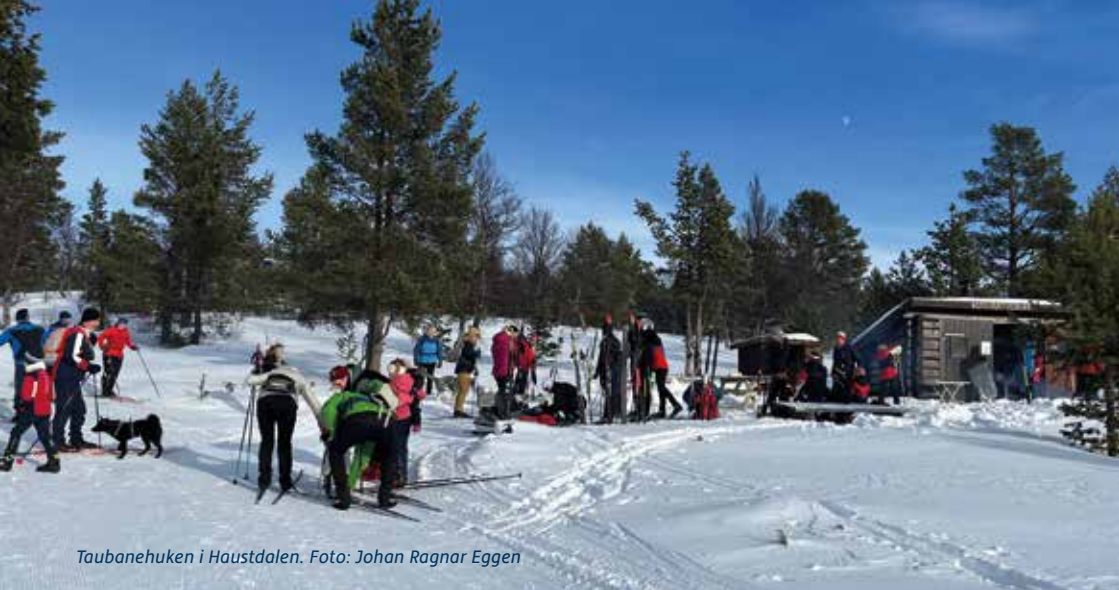
Taubanehuken i Haustdalen.