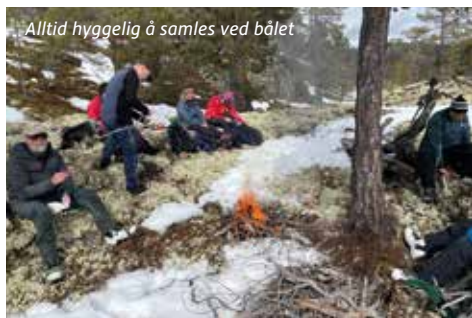
Alltid hyggelig å samles ved bålet

Påmelding: Alvdal-Tynset Sport eller direkte til turleder senest dagen før.