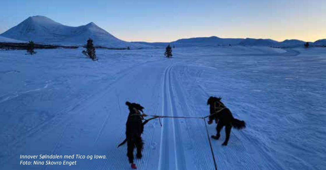
Innover Sølndalen med Tico og Iowa.